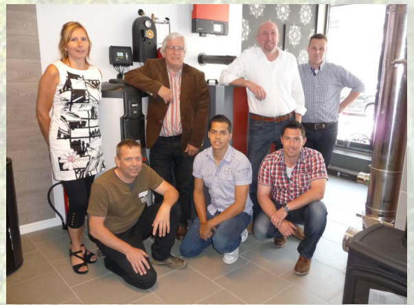
Het Pellets Unique team.

Onze uitgebreide kennis en ervaring willen wij inzetten voor het bieden van goede en betaalbare oplossingen.