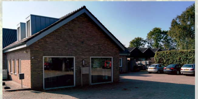
Ons pand te Sint Geertruid